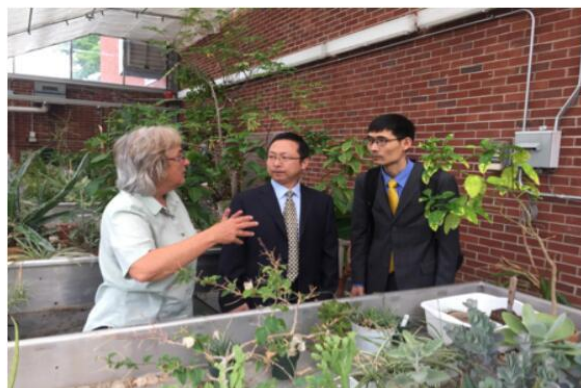
在 SUNY 生物与生态温室