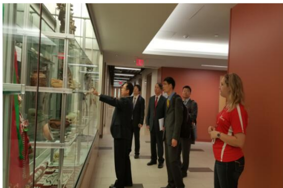
在 SUNY 人类生态科学研究中心