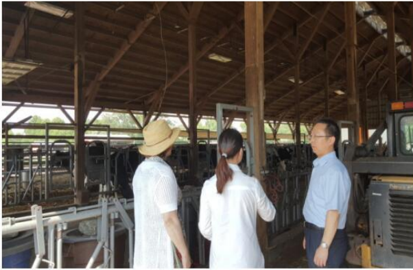
在 Rutgers 大学 Cook/Douglass 校区奶牛场调研