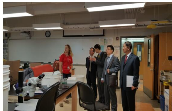
在 SUNY 理学实验室