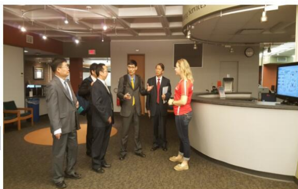
在 SUNY 图书馆